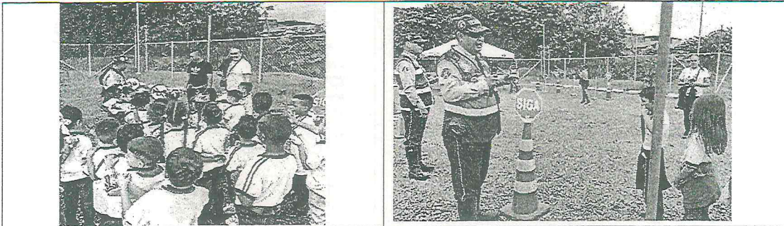
Estrategia para niños y niñas enfocada en enseñarles normas y hábitos para circular de forma segura en la vía pública, tanto como peatones como en vehículos

Así mismo se busca fortalecer la institucionalidad a fin de establecer metas y estrategias a nivel municipal para lograr una reducción significativa en el número de siniestros viales y de víctimas fatales en las vías del territorio.